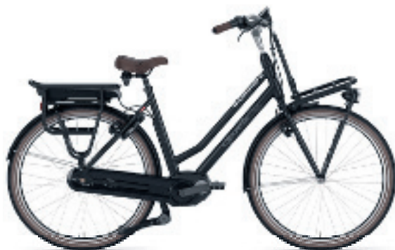
Miss Grace C7 HMB

Kies nu voor dé meest stoere en stijlvolle e-bike.